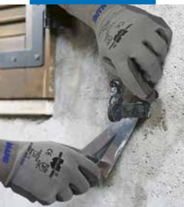
Zastosowanie Lampocem do mocowania śrub kotwiących okiennice