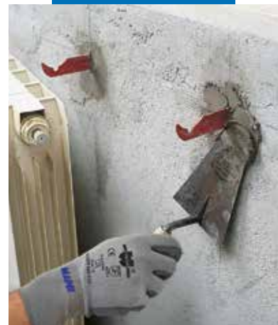
Mocowanie wieszaka kaloryfera z zastosowaniem Lampocem