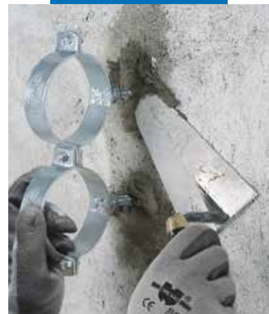
Montaż uchwyty do rur przy użyciu Lampocem