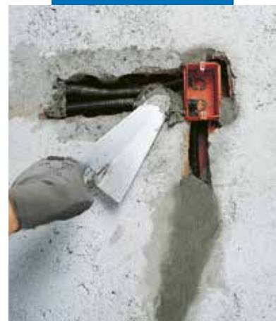
Mocowanie elementów instalacji elektrycznej z zastosowaniem Lampocem